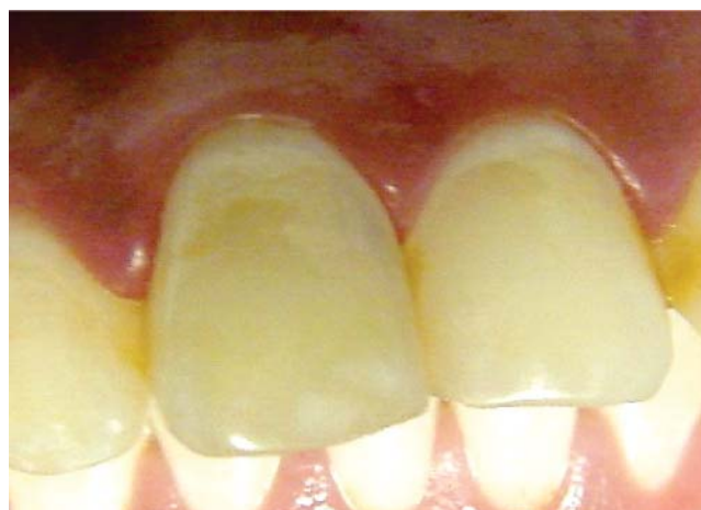
Figura 7. Control a los seis meses; se observa ausencia de discromía.

Los agentes blanqueadores pueden ser a base de peróxido de hidrógeno ( H_2O_2 ) (también conocida como