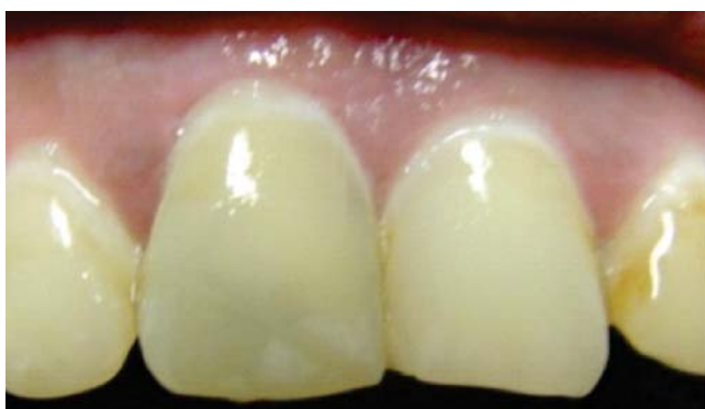
Figura 5. Treinta días después, se aprecia tonalidad adecuada.