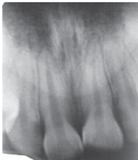
Figura 2. Radiografía inicial; no se observa área radiolúcida.