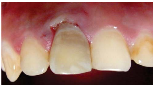
Figura 4. Discromía mínima posterior al blanqueamiento.