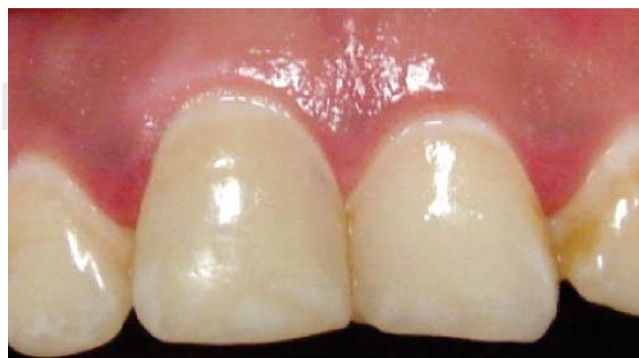
Figura 8. Adecuadas condiciones clínicas a los 12 meses.