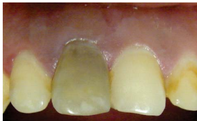
Figura 1. Discromía en el incisivo central superior derecho.

En ese momento, se obtuvo la entrada del conducto con cemento de ionómero de vidrio (Vitrem®) con el propósito de crear una barrera física que evite la microfiltración e impida la reabsorción interna, y se preparó el perborato de sodio mezclado con agua oxigenada (Dermocleen 2.5-3.5%) hasta obtener una consistencia espesa tipo «arena húmeda» para llevarlo a la cámara pulpar utilizando una cucharilla 33L (SS White®); una vez colocado el agente blanqueador,