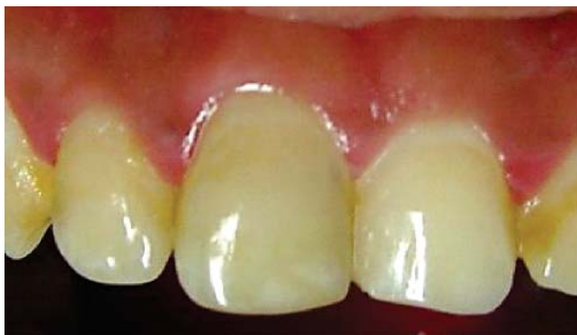
Figura 6. Control a los tres meses; se observa un tono similar a los dientes adyacentes.

se introdujo al rojo vivo el instrumento caliente, lo que permitió la liberación de oxígeno. Este procedimiento se realizó dos veces, y al término de éste, se obturó con cemento temporal (Cavit 3M ESPE®), observando una ligera mejoría en cuanto al color del órgano dentario (Figura 4).