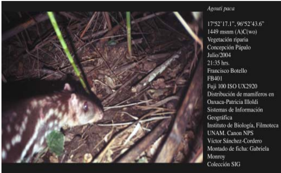
Figura 1. Registros fotográficos montados de Agouti paca para su inclusión en colección científica según Botello (2004). a. Fotografía tomada en vegetación riparia, rodeada de bosque tropical caducifolio (arriba). b. Fotografía tomada en bosque de pino-encino (abajo).