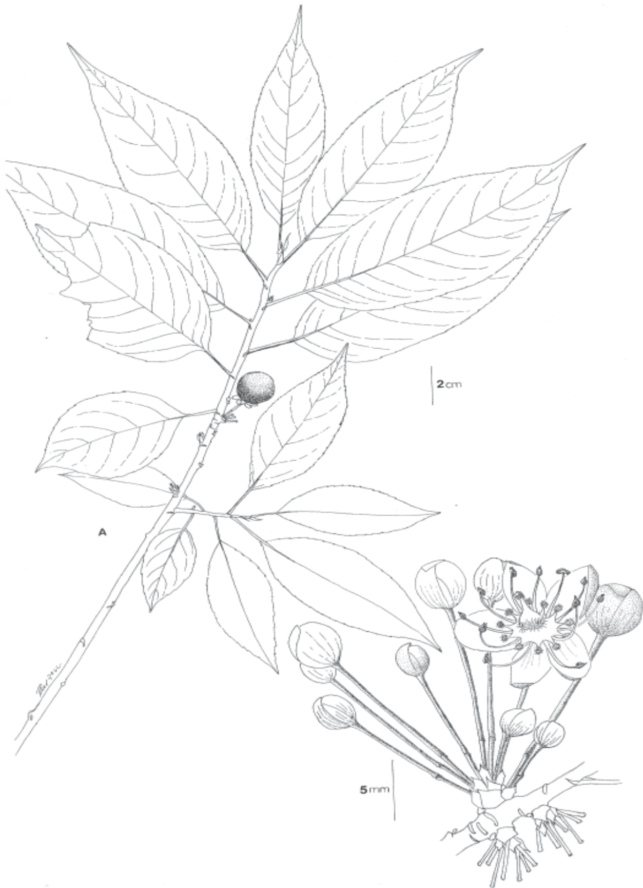
Figura 1. Casearia sanchezii sp. nov. A) Rama con frutos. B) Inflorescencia, mostrando una flor abierta. A tomado de Linares et al. 6035 y B tomado de Linares et al. 4499, ambos en MEXU.