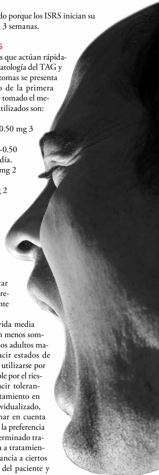
Pedro J. Pérez

Los fármacos de vida media corta (6-8 h) producen menos somnolencia diurna y en los adultos mayores no suelen inducir estados de confusión. Deben de utilizarse por el menor tiempo posible por el riesgo potencial de inducir tolerancia y adicción. El tratamiento en general debe ser individualizado, es decir, hay que tomar en cuenta ciertos factores, como la preferencia del paciente hacia determinado tratamiento, la respuesta a tratamientos anteriores, intolerancia a ciertos medicamentos, edad del paciente y enfermedades comórbidas. ●