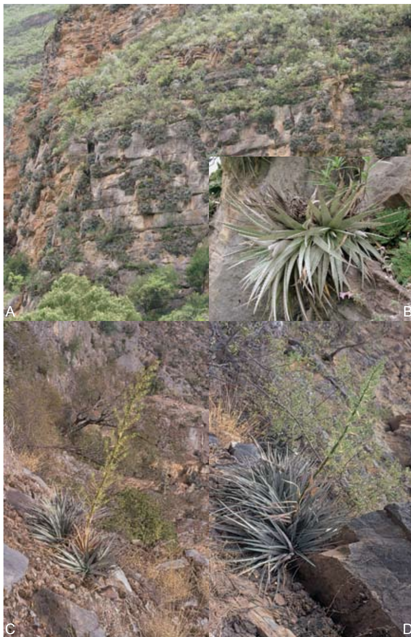
Fig. 2. Hechtia zamudioi . A. población creciendo sobre taludes calizos; B. rosetas; C. planta masculina; D. planta femenina.