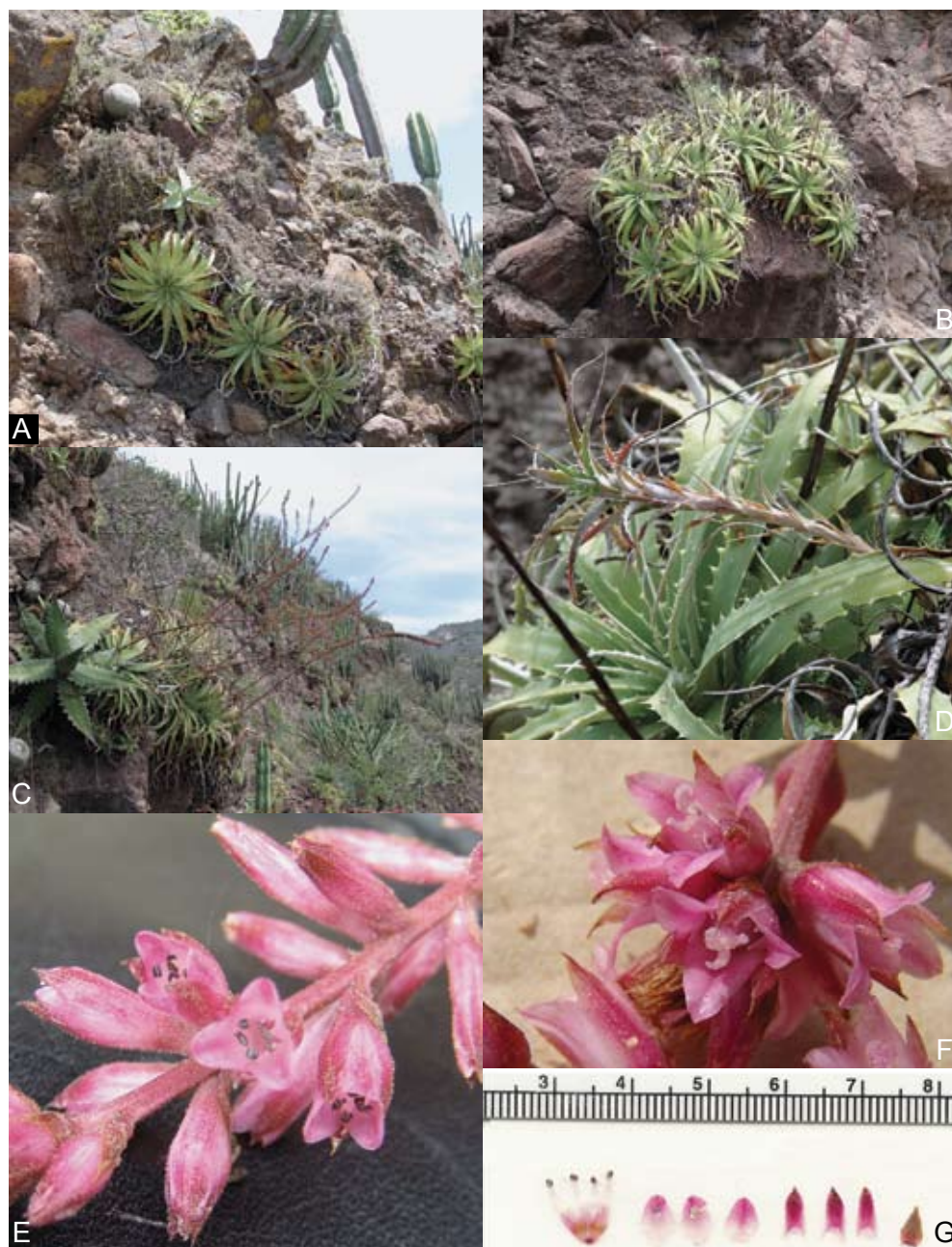
Fig. 1. Hechtia pretiosa . A. y B. hábito; C. plantas en anthesis; D. estolón; E. flores masculinas; F. flores femeninas; G. flor masculina disecada.