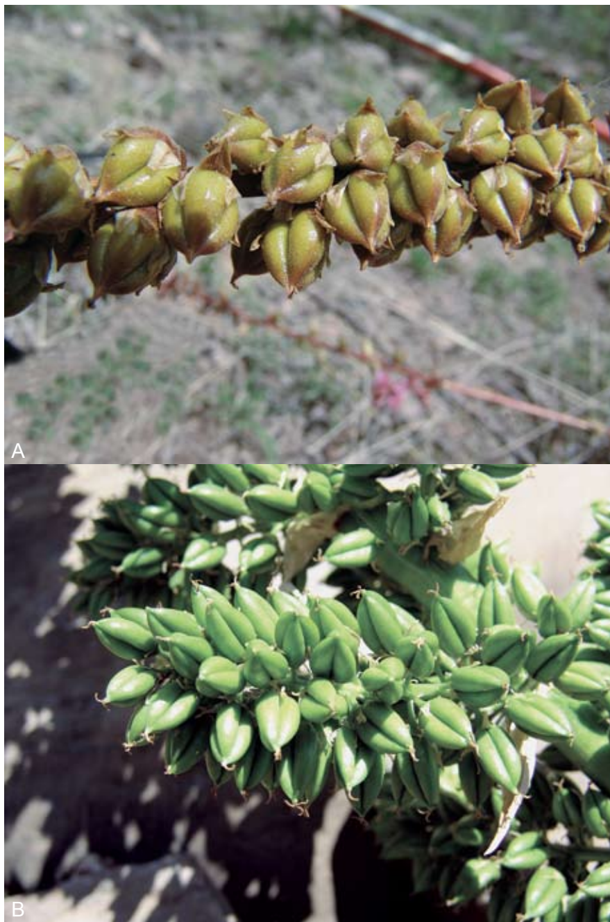
Fig. 3. A. Hechtia pretiosa , frutos; B. Hechtia zamudioi , frutos.